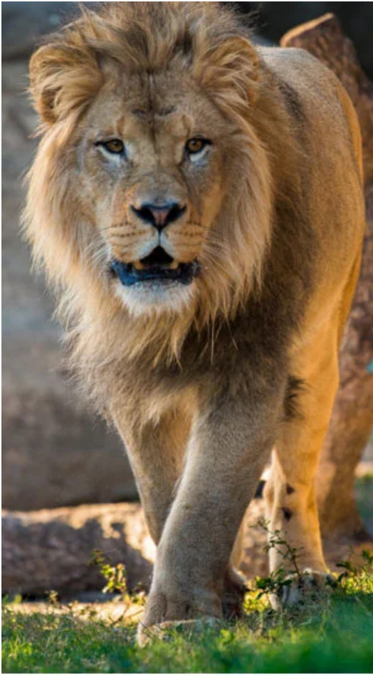
// African lion