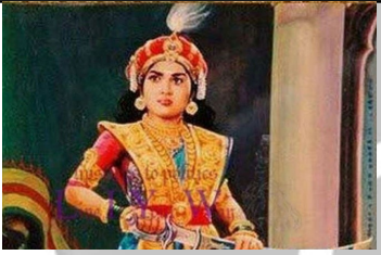
रानी वेलु नचियार