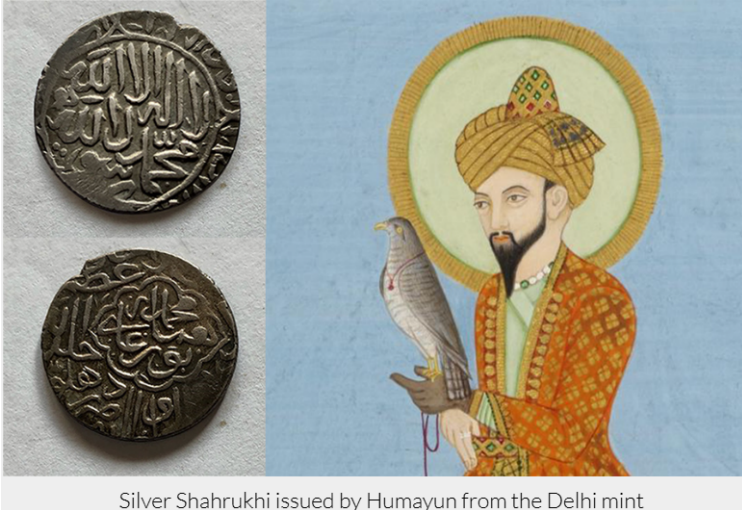
Silver Shahrukhi issued by Humayun from the Delhi mint