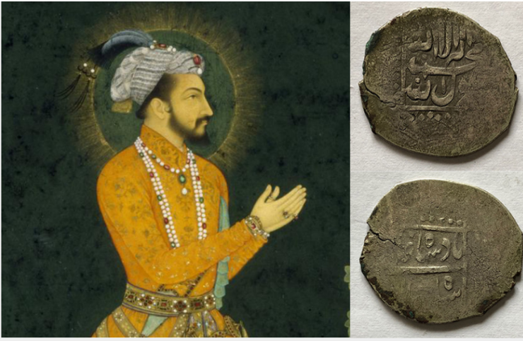
Silver mishqal issued by Shah Jahan—this denomination was discontinued during his reign