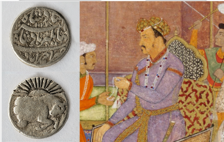
Zodiac coin (Taurus) issued by Jahangir