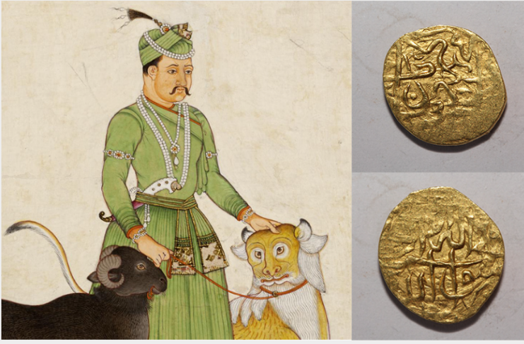
One-tenth gold mohur issued by Akbar