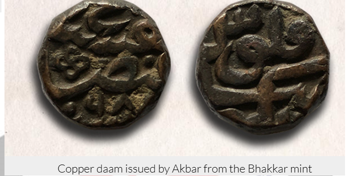
Copper daam issued by Akbar from the Bhakkar mint