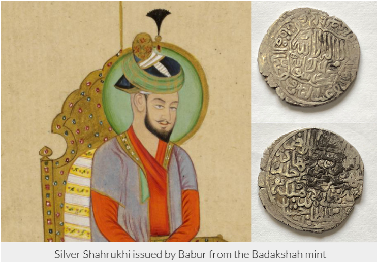
Silver Shahrukhi issued by Babur from the Badakshah mint