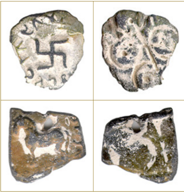
Coins of the Satavahana