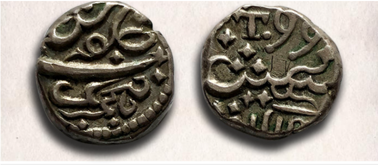
One-tenth silver rupee issued by the East India Company in the name of Alamgir II from Tellicherry mint