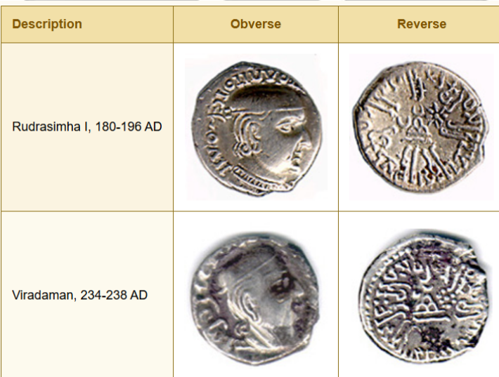
Coins of the Western Kshatrapas