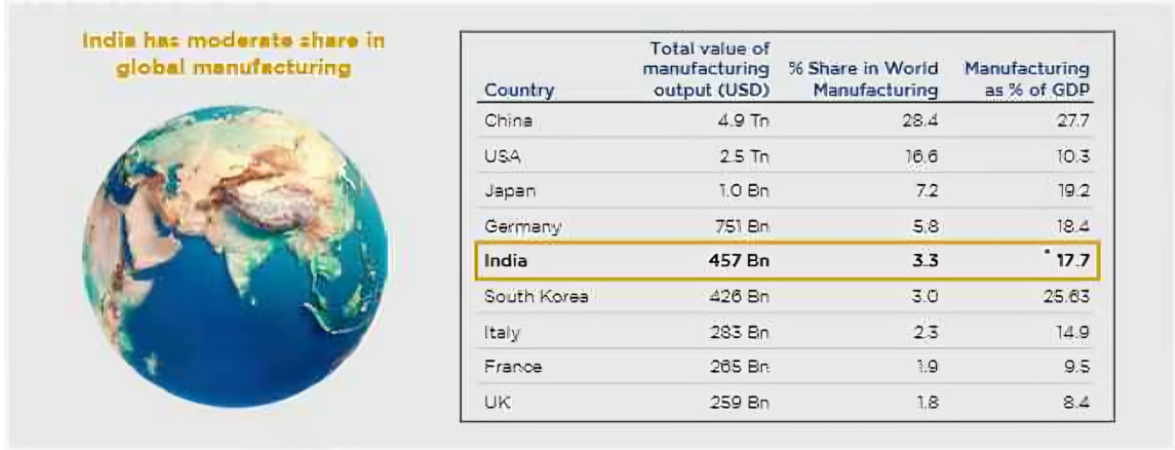
// Table 1: Global Manufacturing Landscape

इसमें 457 बिलियन अमेरिकी डॉलर का योगदान देता है, जो वैश्विक हिससेदारी का 3.3% है, जो प्रमुख भागीदारों से काफी कम है।