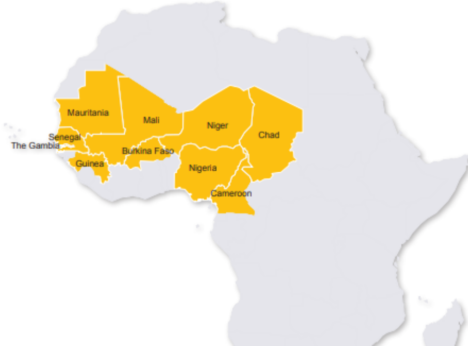
Boundaries of the Sahel within the context of the United Nations