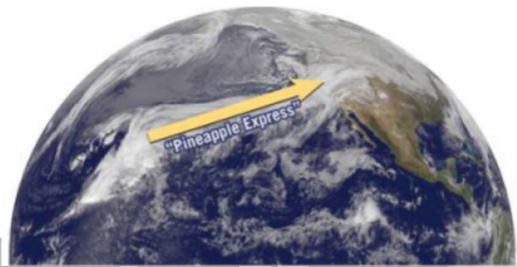
Satellite image of clouds over the Pacific Ocean illustrating the "Pineapple Express," a phenomenon in which a strong jet stream carries mT air from as far away as Hawaii to the West Coast.