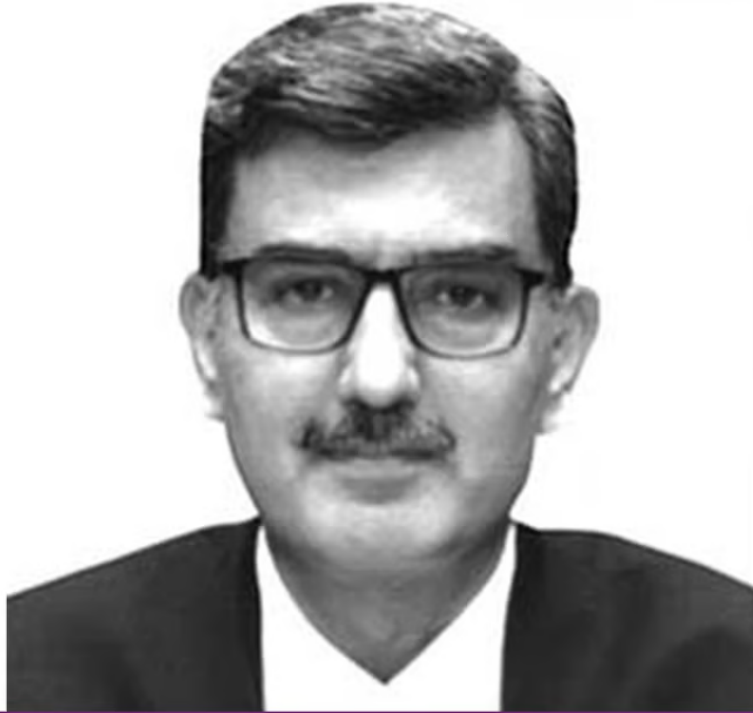
JUSTICE SHEEL NAGU