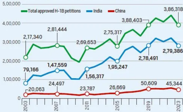
CHART 1: NUMBER OF H-1B PETITIONS APPROVED BY USCIS (2003-23)