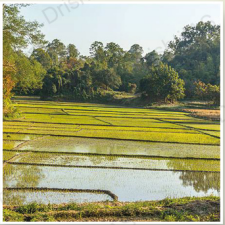
त्रिपुरा में डेबरी या छबिमुड़ा (सितंबर 2022)