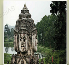
मध्य प्रदेश में अमरकंटक (जुलाई 2022)