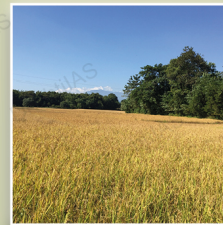
असम में बोरजुली वाइल्ड राइस साइट (अगस्त 2022)