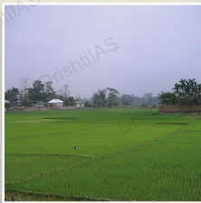
बेटलिंगशिब और त्रिपुरा में इसके आसपास का क्षेत्र (सितंबर 2022)