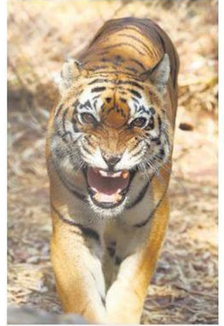
Steady rise: A tiger at Van Vihar National Park in Bhopal on Sunday.