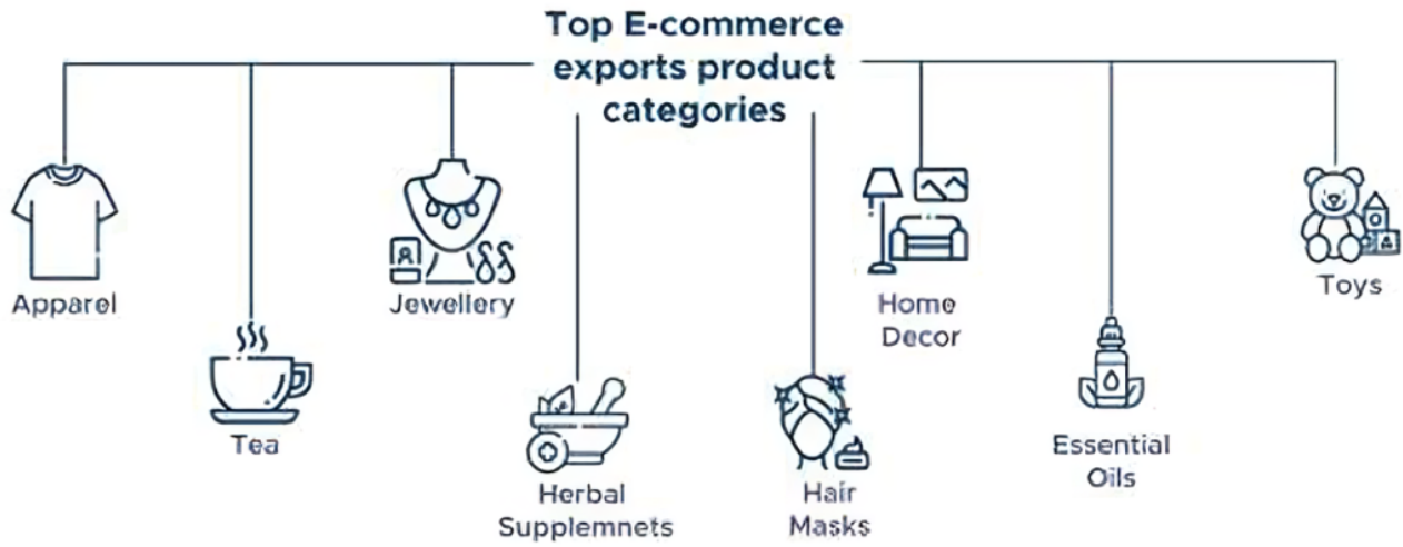
Figure 3.2: Top e-commerce product categories with high growth and Indian "Heritage" products