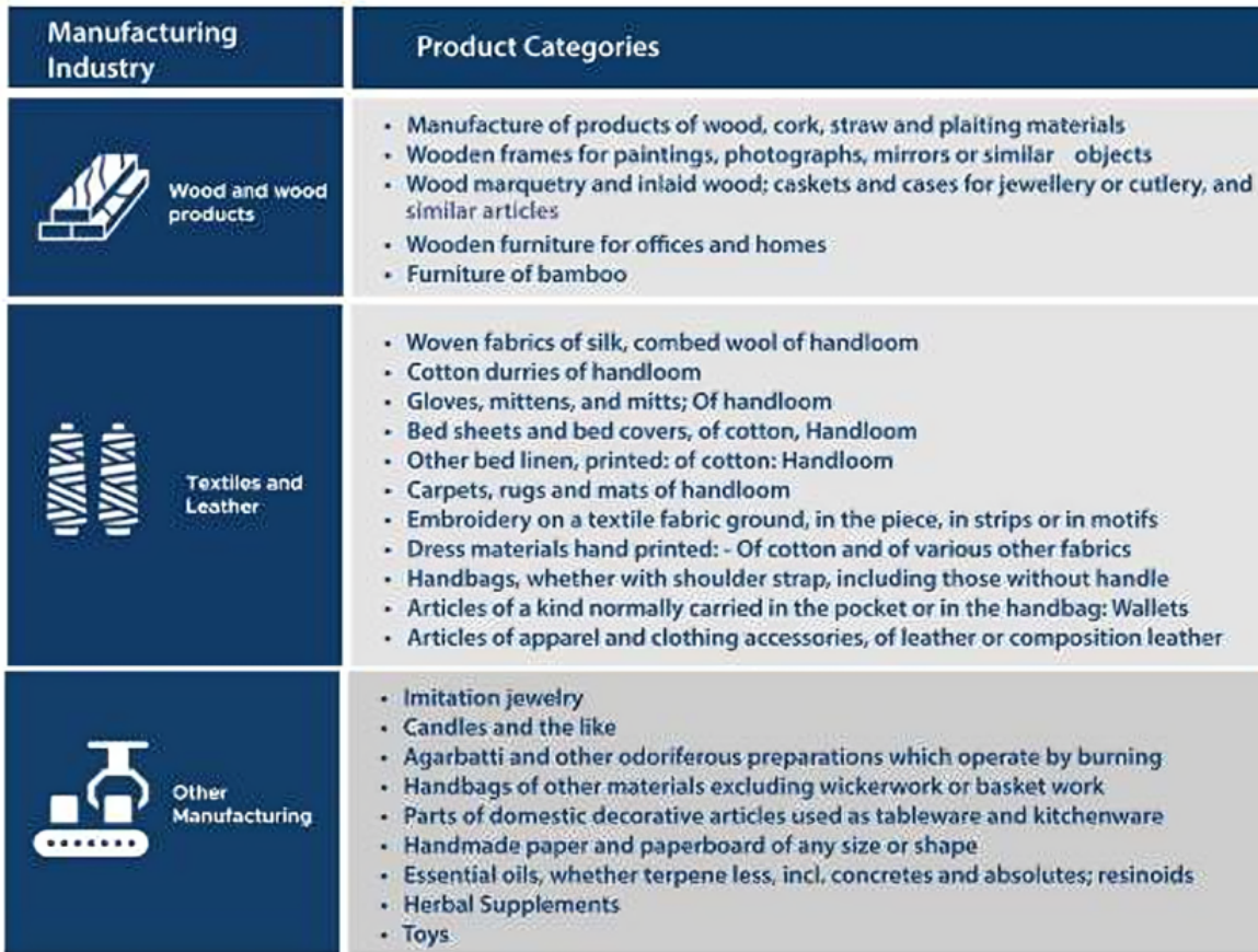
Table 3.1: Product categories well suited for exports from MSMEs