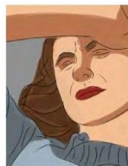
Sensitivity to light