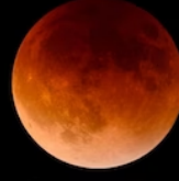
Super Flower Blood Moon

Occurs during a total lunar eclipse when the Earth is between moon and sun. During this time, the Moon is lit only by the edges of the Earth's atmosphere which scatters blue but not red light.