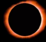
Ring of Fire Eclipse

The Flower Moon is the second full moon of spring and May's full moon. When it also meets both "supermoon" and "blood moon" criteria, it becomes the Super Flower Blood Moon.