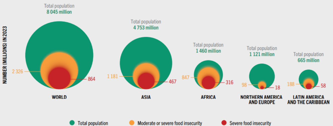
FIGURE 5 THE CONCENTRATION AND DISTRIBUTION OF FOOD INSECURITY BY SEVERITY IN 2023 DIFFERED GREATLY ACROSS THE REGIONS OF THE WORLD