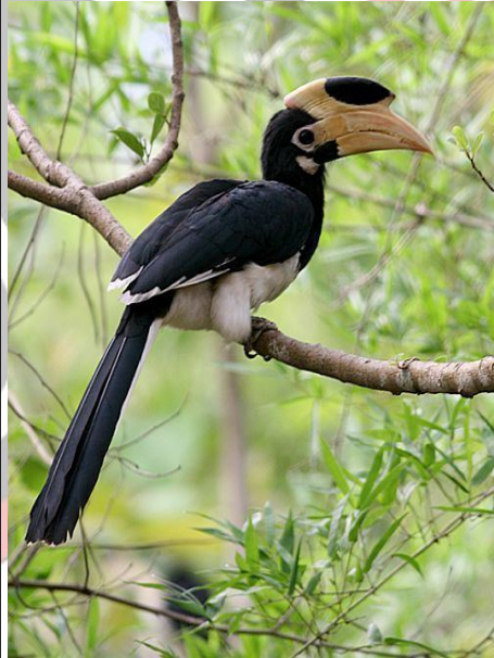
मालाबार पाइड हॉर्नबलि