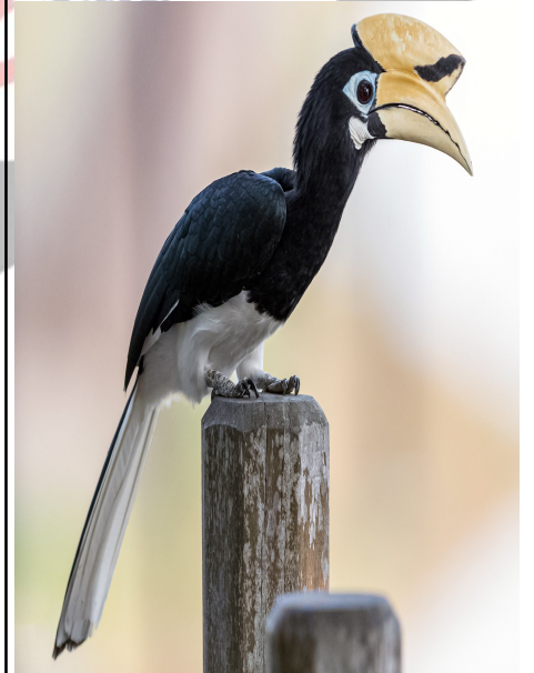
ओरफिटल पाइड हॉर्नबलि