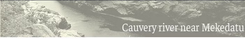
Cauvery river near Mekedatu