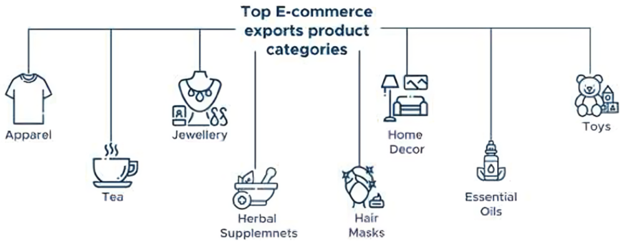
Figure 3.2: Top e-commerce product categories with high growth and Indian "Heritage" products