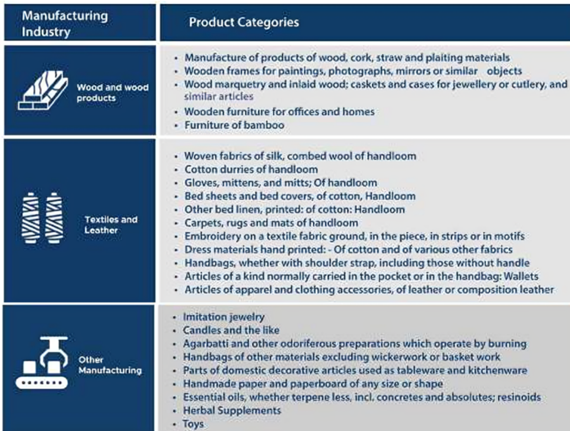
Table 3.1: Product categories well suited for exports from MSMEs