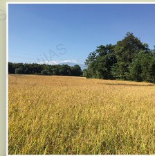
असम में बोरजुली वाइल्ड राइस साइट (अगस्त 2022)