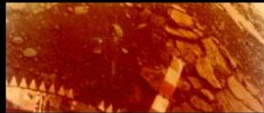
The surface of Venus photographed by a Russian probe in 1982

SURFACE CONDITIONS AIR PRESSURE: 90x Earth TEMPERATURE: 870°F (465°C) WINDS: up to 220 mph (100 m/s)