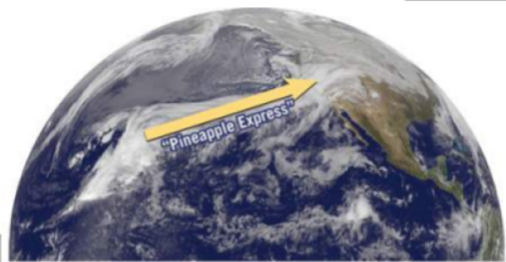
Satellite image of clouds over the Pacific Ocean illustrating the "Pineapple Express," a phenomenon in which a strong jet stream carries mT air from as far away as Hawaii to the West Coast.