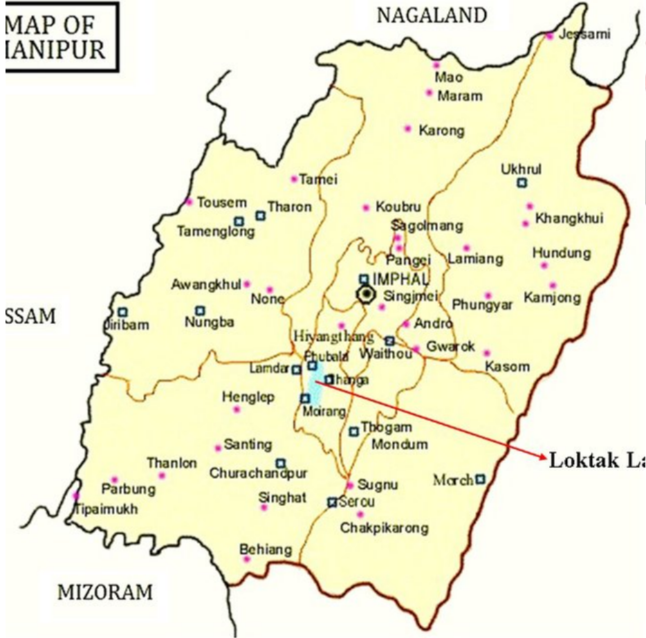
MAP OF IANIPUR