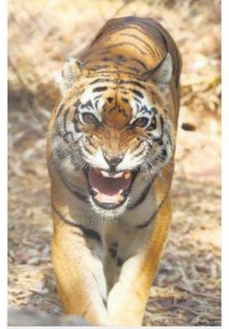
Steady rise: A tiger at Van Vihar National Park in Bhopal on Sunday.