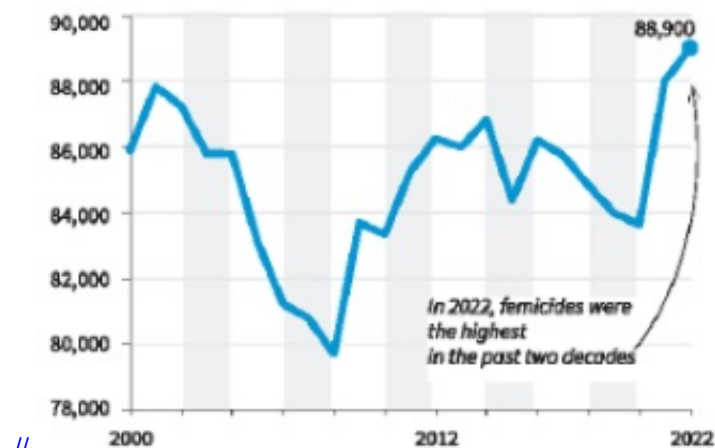
Chart 1: The chart shows the year-wise intentional murder of women/ girls across the globe for gender-related reasons