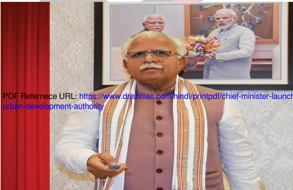
PDF Reference URL: https://www.drishtias.com/hindi/printpdf/chief-minister-launched-10-faceless-services-of-haryana-urban-development-authority